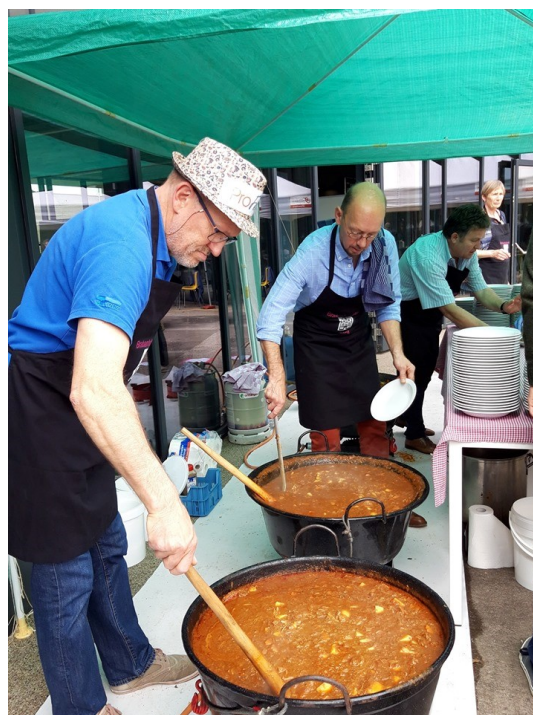
Photos : à gauche : la photo de présentation de la paroisse de Hodimont à droite : service de la goulash pour le repas de midi